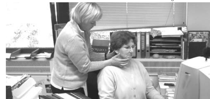
Het is eigenlijk voor iedereen wel nuttig, zo'n cursus